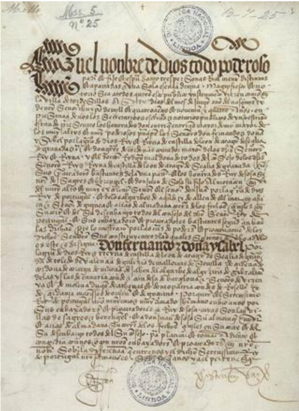
Biblioteca Nacional de Portugal El Tratado de Tordesillas fue el resultado de un proceso de un año repleto de incertidumbre.