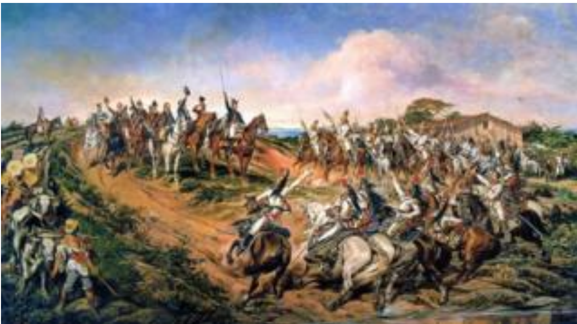
Museu do Ipiranga Pedro I declaró la Independencia de Brasil en las orillas del río Ipiranga.

Graham coincide con la tesis de Ávila Rueda. "Si te independizas de España, ¿por qué querrás quedar sometido a los mandos y desmanes de, por ejemplo, Buenos Aires? Las fronteras actuales de los países de América Latina tardaron en consolidarse y fueron en muchos casos el resultado de disputas internas que acontecieron después de la independencia", explica.