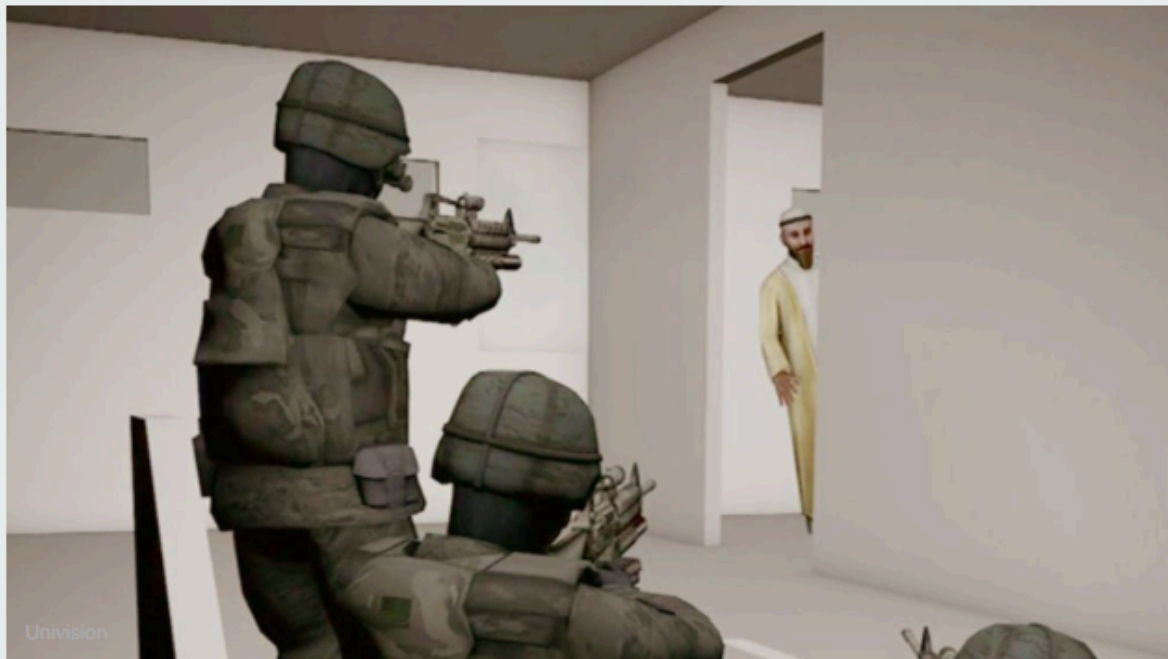
Controversia por soldado que confesó haber matado a Bin Laden

Del mismo modo, consciente de ser el objetivo primordial de las agencias de Estados Unidos, vive preocupado por los avances tecnológicos que puedan descubrir su posición exacta y que puedan abrir el camino a su detención.